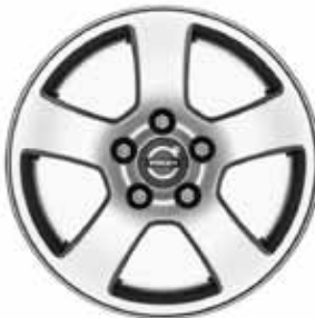
Isis 6,0 x 15"