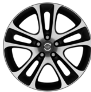
Atreus 7,5 x 18"