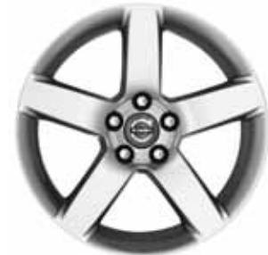
Serapis 7,0 x 17"