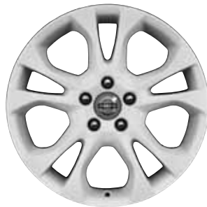
Styx White 7,0 x 17"