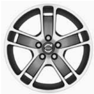
Zaurak Graphit/Silber 7,0 x 17"