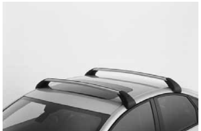
Lastenträger „Highline“. Elegantes Aluminium-Profil mit T-Nut. Kann mit Schlössern ergänzt werden.