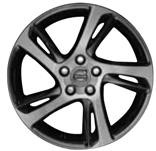
Spider 7,0 x 17"