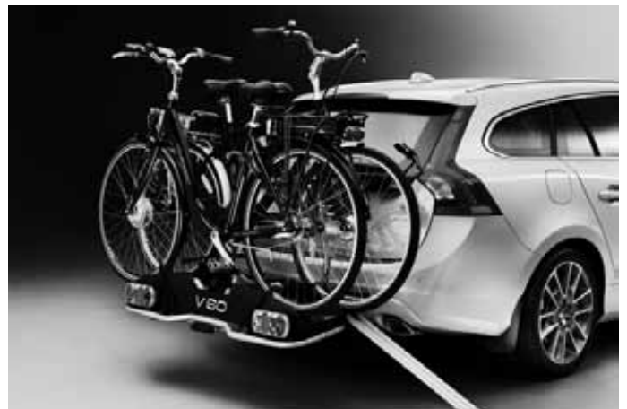
Fahrradträger „E-Bike“ und Laderampe, für Anhängerkupplung. Für bis zu zwei Elektrofahräder. Nur in Verbindung mit Anhängerkupplung.

Weiteres Zubehör sowie die aktuellen unverbindlichen Preisempfehlungen der Volvo Car Germany GmbH entnehmen Sie bitte den Zubehörlisten auf www.volvocars.de