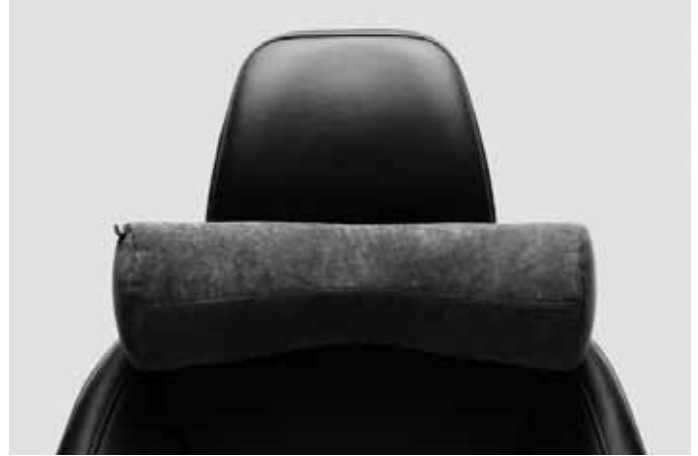
Komfortkissen. Weich gepolstertes Nackenkissen zur Befestigung an jeder Kopfstütze. Bezug abnehmbar und waschbar.