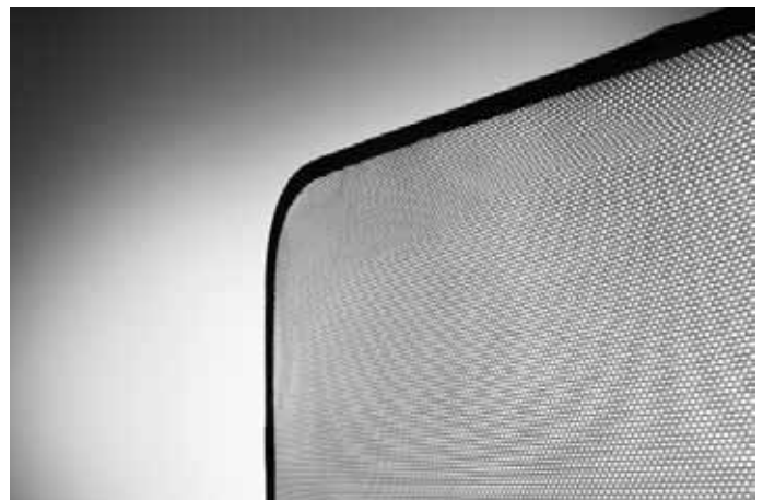
Passform-Sonnenschutzblenden. Für die Hintertüren (Paar) und den Gepäckraum (dreiteiliger Satz) erhältlich. Einfache Klemmbefestigung.