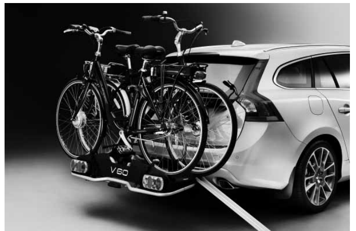
Fahrradträger „E-Bike“ und Laderampe, für Anhängerkupplung. Für bis zu zwei Elektrofahrräder. Nur in Verbindung mit Anhängerkupplung.