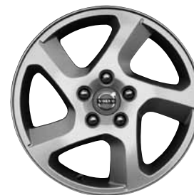
Convector 6,5 x 16"