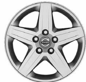
Ceryx 6,5 x 16-Zoll