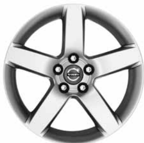
Serapis 7,0 x 17"

1) Entfall der Leichtlaufreifen. 2) Nicht in Verbindung mit Sportfahrwerk.