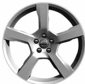
Cratus 7,0 x 17"