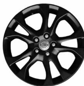
Styx Black 7,0 x 17"