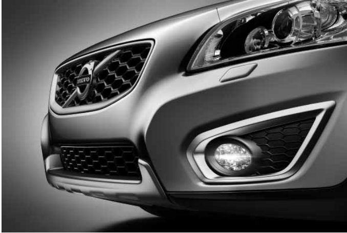
Frontspoilereinsatz und Dekorrahmen vorn (Paar), Aluminium-Optik. Nicht in Verbindung mit R Design Edition und R Design Edition Pro.