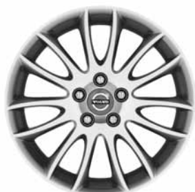
Spartacus 7,0 x 17"