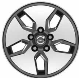
Libra 6,5 x 16"