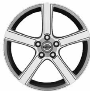
Midir, Silber 7,5 x 18-Zoll