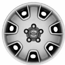
Stahlfelge mit Radzierblende