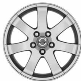
Cordelia 6,5 x 16"