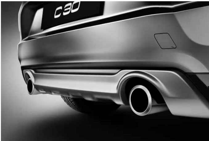
Heckschürzeneinsatz, Aluminium-Optik und Sport-Endrohre (Paar), Edelstahl poliert. Sport-Endrohre nur für Motorisierungen D4 und T5. Nicht in Verbindung mit R Design Edition und R Design Edition Pro. Nicht in Verbindung mit D2 Start/Stop.

Die Zubehöre Frontspoilereinsatz, Dekorrahmen, Schwellerleisten und Heckschürzeneinsatz sind auch erhältlich als komplettes Designpaket mit Preisvorteil.