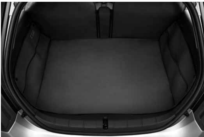
Gepäckraum-Schutzmatte. Vollflächige Abdeckung des Gepäckraumes bis zur Unterkante der Fenster. Integrierte Taschen links und rechts. Robustes und flexibles Vinylnmaterial.