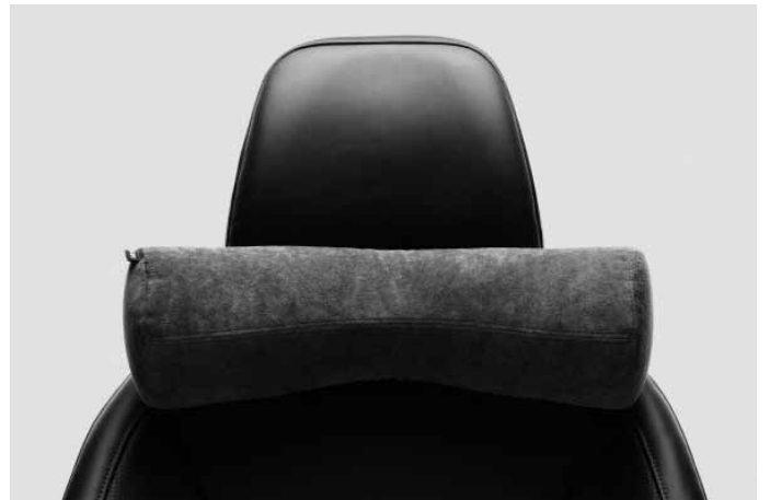
Komfortkissen. Weich gepolstertes Nackenkissen zur Befestigung an jeder Kopfstütze. Bezug abnehmbar und waschbar.

Die Zubehöre Frontspoilereinsatz, Dekorrahmen, Schwellerleisten und Heckschürzeneinsatz sind auch erhältlich als komplettes Designpaket mit Preisvorteil.