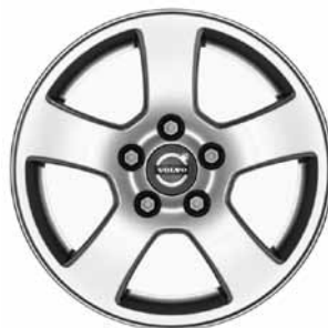
Isis 6,0 x 15-Zoll