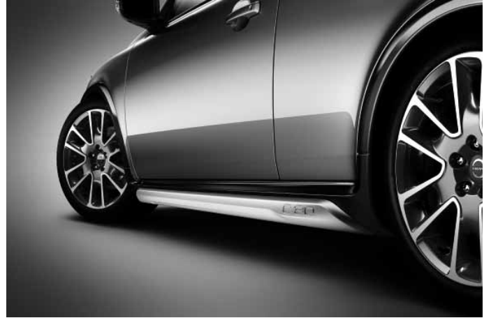
Schwellerleisten (Paar), Aluminium-Optik, mit Schriftzug „C30“. Nicht in Verbindung mit R Design Edition und R Design Edition Pro.