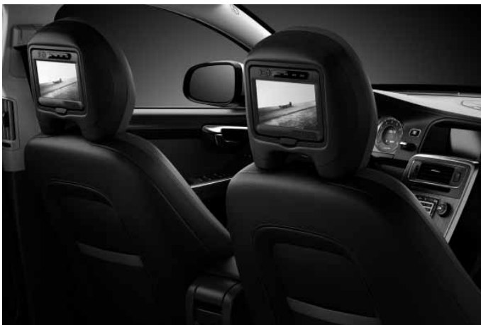
Rear Seat Entertainment (RSE). Zwei Bildschirme mit integrierten DVD-Playern.