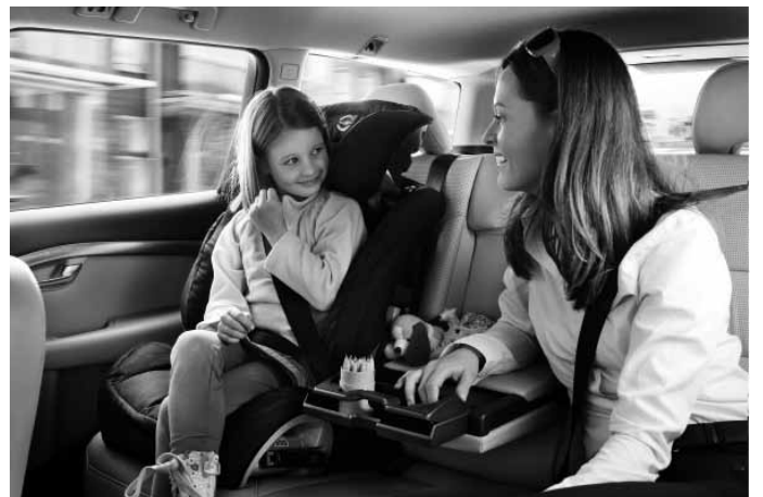
Gurtkissen mit Rückenlehne. Gruppe III, für Kinder von ca. 15 bis 36 kg Körpergewicht. Erfüllt die Normen ECE R44-04 und Öko-Tex Standard 100.

Weiteres Zubehör sowie die aktuellen unverbindlichen Preisempfehlungen der Volvo Car Germany GmbH entnehmen Sie bitte den Zubehörlisten auf www.volvocars.de