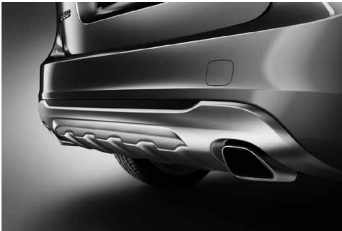
Heckschürzeneinsatz, Aluminium-Optik und Sport-Endrohre, Edelstahl poliert. Für Motorisierungen D2, D3 und D4 ein Endrohr, für alle anderen zwei Endrohre.

Die Zubehöre Frontspoilereinsatz, Dekorrahmen, Schwellerleisten und Heckschürzeneinsatz sind auch erhältlich als komplettes Designpaket mit Preisvorteil. Sie sind nicht montierbar in Verbindung mit R Design.