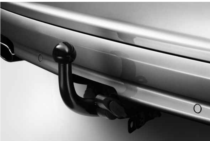
Anhängerkupplung, fest oder abnehmbar.