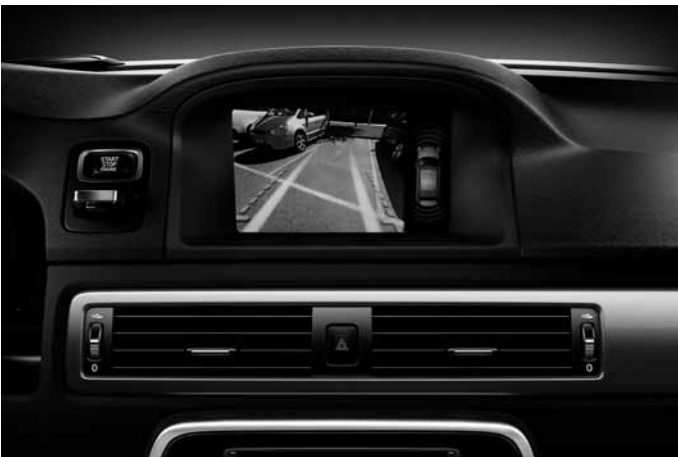
Rückfahrkamera. Nur in Verbindung mit Audiopaket „High Performance Multimedia“ oder Audiopaket „Premium Sound Multimedia“.