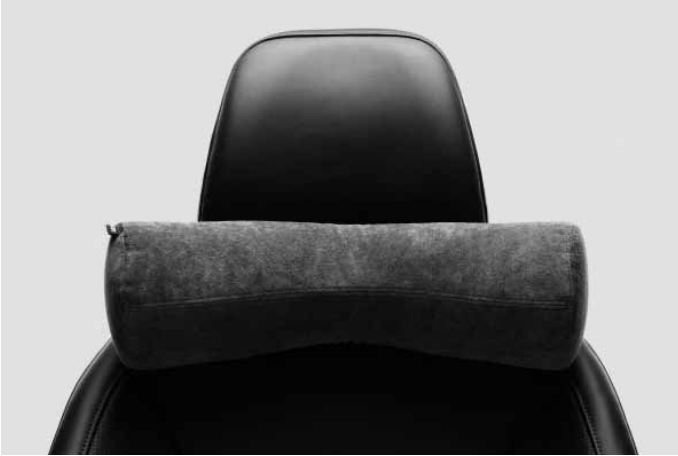
Komfortkissen. Weich gepolstertes Nackenkissen zur Befestigung an jeder Kopfstütze. Bezug abnehmbar und waschbar.