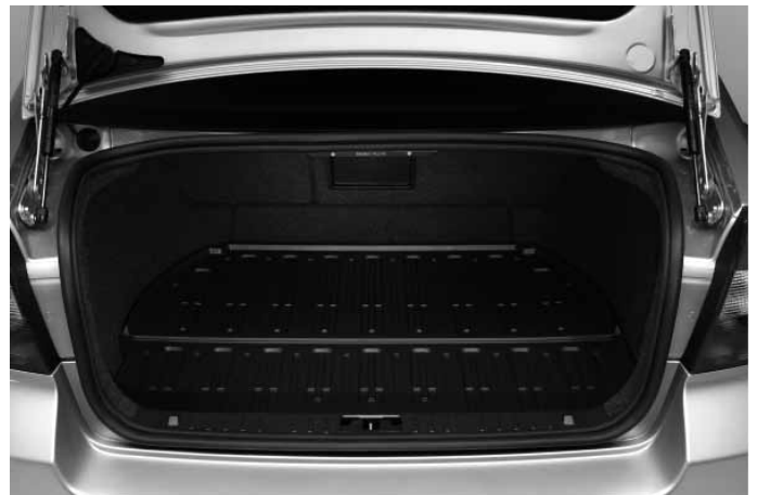
Gepäckraum-Schalenmatte. Mittig klappbar, für Zugang zum Gepäckraumboden.