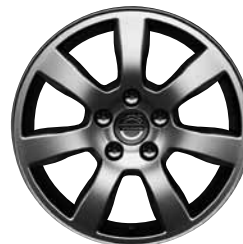
Oden 7,0 x 16-Zoll