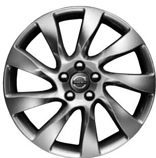
Magni 8,0 x 18"