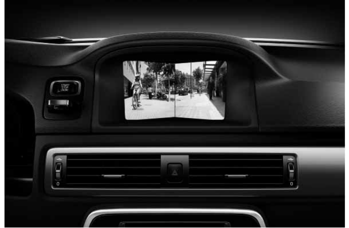
Frontkamera. Nur in Verbindung mit Audiopaket High Performance Multimedia oder Audiopaket Premium Sound Multimedia.