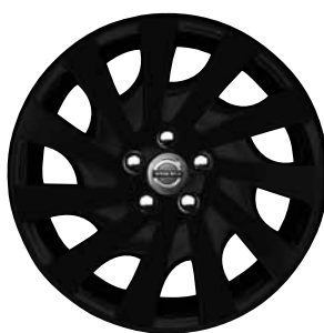
Saga Black 7,0 x 17"