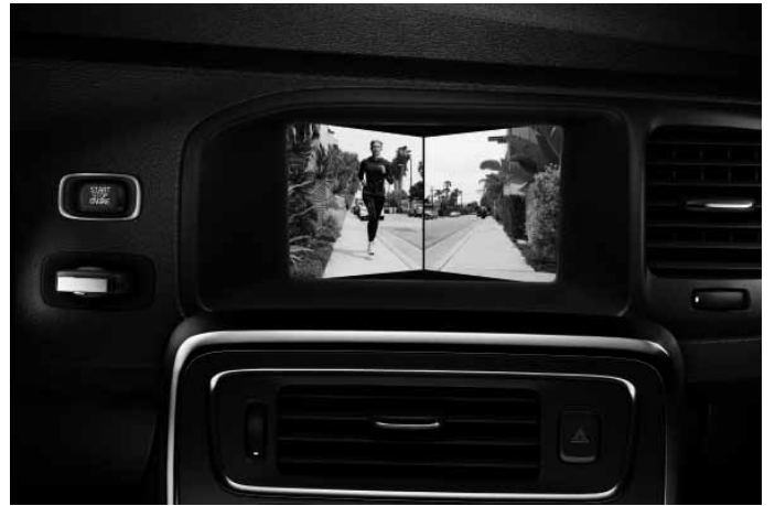
Frontkamera. Nur in Verbindung mit Audiopaket High Performance Multimedia oder Audiopaket Premium Sound Multimedia.

Die Zubehöre Frontspoilereinsatz, Dekorrahmen, Schwellerleisten und Heckschürzeneinsatz sind auch erhältlich als komplettes Designpaket mit Preisvorteil. Sie sind nicht montierbar in Verbindung mit R Design.