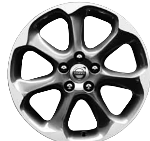
Pontos 7,5 x 17"