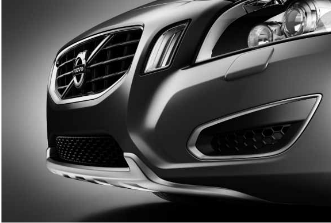
Frontspoilereinsatz und Dekorrahmen vorn (Paar), Aluminium-Optik.