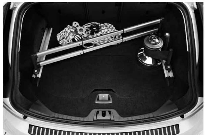
Gepäckraum-Organizer, vierteilig. Zwei Gleitschienen mit Klemmbefestigung, ein Spanngurt sowie eine Teleskop-Doppelstange. Unterer Bildrand: Stoßfänger-Schutzfolie, teiltransparent.

Weiteres Zubehör sowie die aktuellen unverbindlichen Preisempfehlungen der Volvo Car Germany GmbH entnehmen Sie bitte den Zubehörlisten auf www.volvocars.de