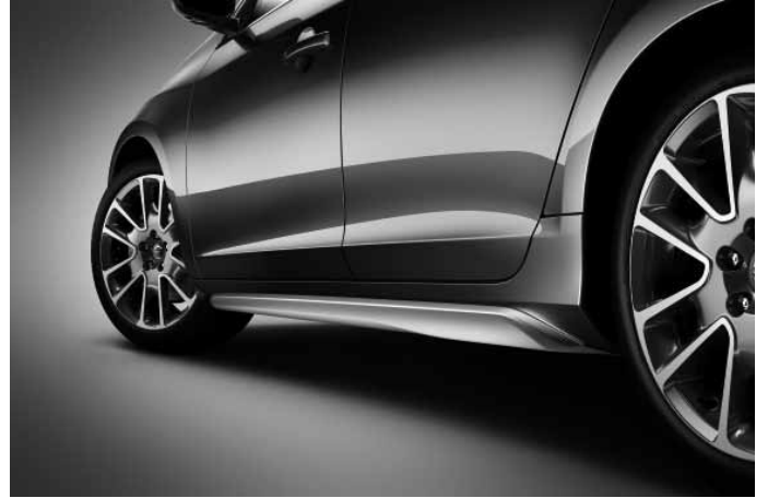
Schwellerleisten (Paar), Aluminium-Optik.