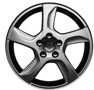
Balder 7,0 x 17"