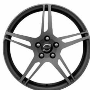
Izar, Hellgrau 8,0 x 18"