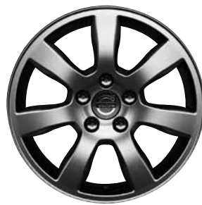
Oden 7,0 x 16"