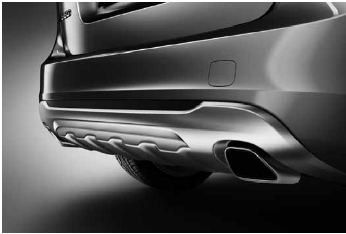
Heckschürzeneinsatz, Aluminium-Optik und Sport-Endrohre, Edelstahl poliert. Für Motorisierungen D2, D3, und D4 FWD ein Endrohr, für alle anderen zwei Endrohre.

Die Zubehöre Frontspoilereinsatz, Dekorrahmen, Schwellerleisten und Heckschürzeneinsatz sind auch erhältlich als komplettes Designpaket mit Preisvorteil. Sie sind nicht montierbar in Verbindung mit R Design.