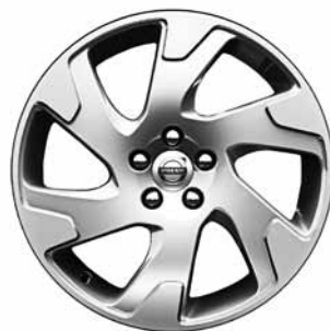
Argus 8,0 x 18"