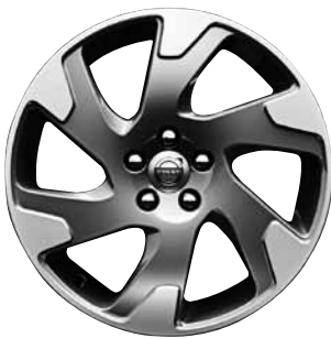
Argus Diamantschnitt/Hellgrau 8,0 x 18"