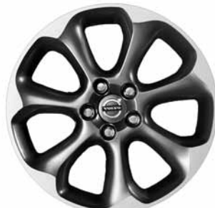
Pontos Diamantschnitt/Hellgrau 7,5 x 17"