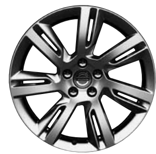
Sleipner 8,0 x 18"