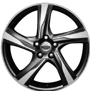
Ixon 8,0 x 18"