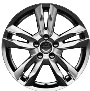
Njord 8,0 x 17"