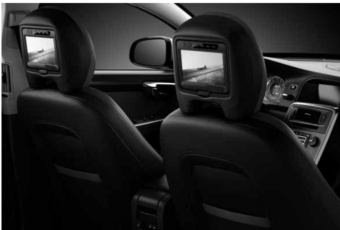
Rear Seat Entertainment (RSE). Zwei Bildschirme mit integrierten DVD-Playern.