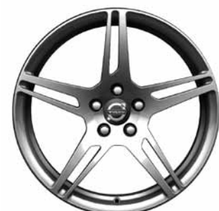
Izar, Silber 8,0 x 18"