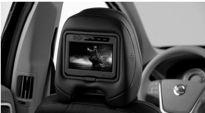
RSE (Rear Seat Entertainment), Volvo XC60