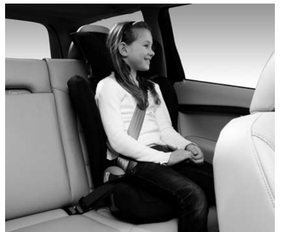
Gurtkissen mit Rückenlehne