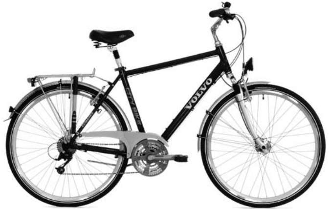
Volvo CITY BIKE, Herren