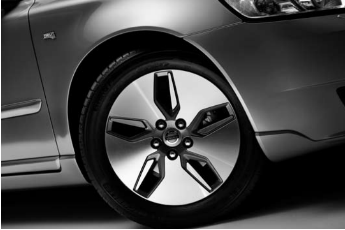
Leichtmetallfelge „Libra“ 6,5x16“, Volvo C30, S40, V50