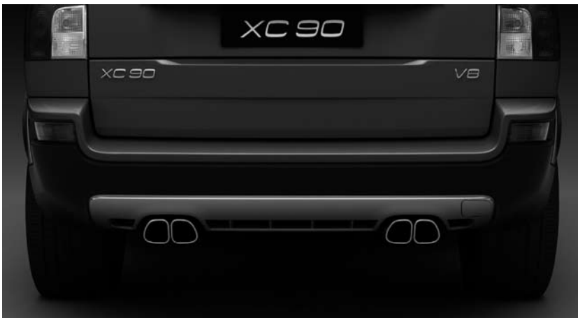
Endrohre mit Heckschürze, R-Design, Volvo XC90