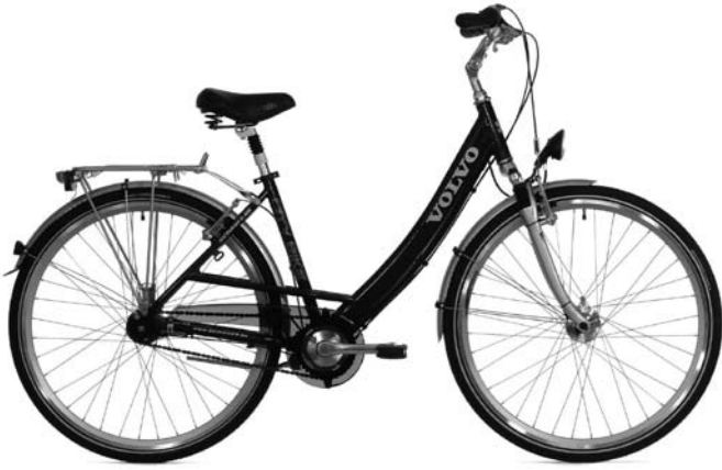
Volvo CITY BIKE, Damen