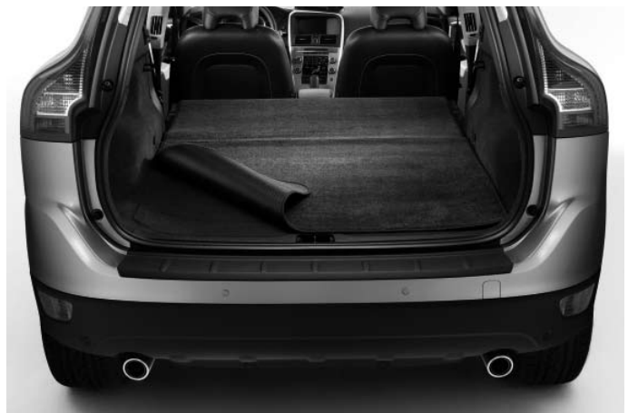
Gepäckraum-Wendematte, extra lang (Volvo XC60)