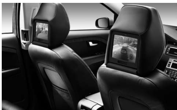
Rear Seat Entertainment (RSE) „Dual-Screen“