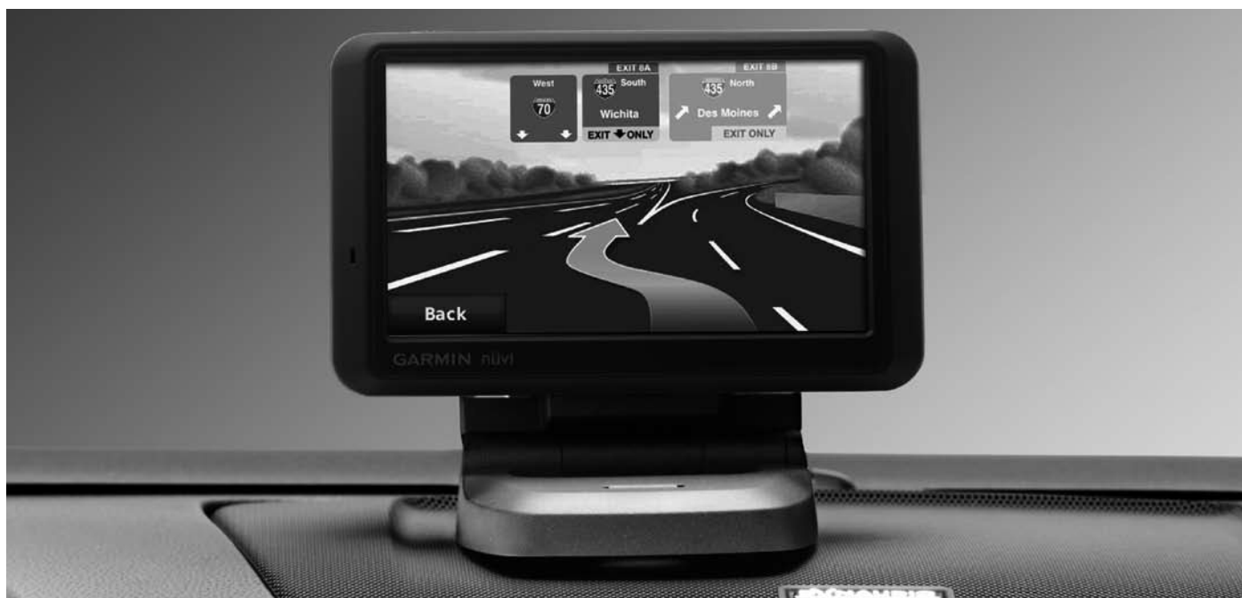
Mobile Navigation Garmin Nüvi 765