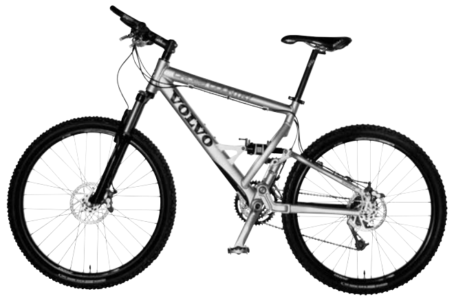
Volvo Bike CROSS COUNTRY