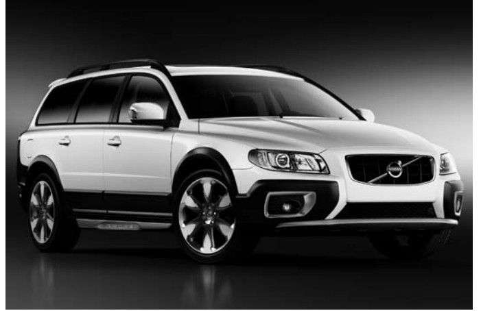
Leichtmetallfelge „Erakir“ Diamantschnitt/Grau 8,0x19“, Volvo XC60, XC70