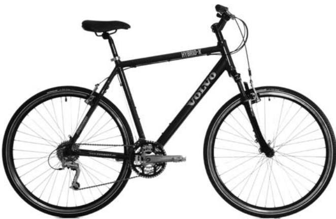
Volvo Bike Hybrid-X