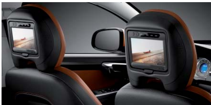
Rear Seat Entertainment „Dual Screen“ (RSE)