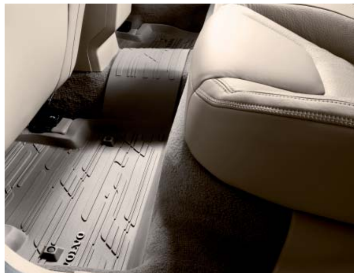
Fußmattensatz, Gummi; Tunnelmatte, Gummi