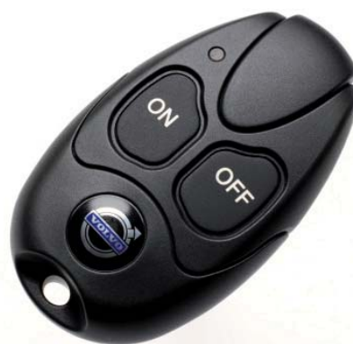
Fernbedienung für Volvo Standheizung