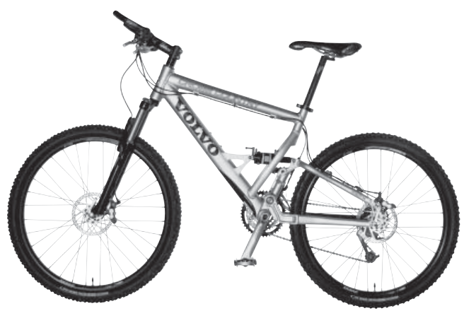
Volvo Bike CROSS COUNTRY