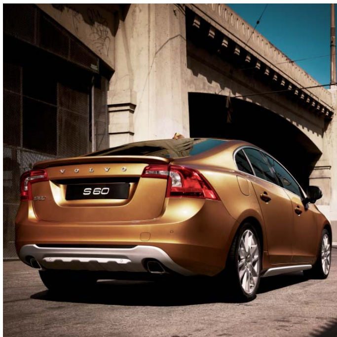
Außendesign: Heckschürzeneinsatz, Endrohre, Schwellerleisten, Heckspoiler