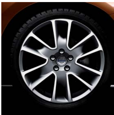
„Freja“, Diamantschnitt/Dunkelgrau, 8,0x18"