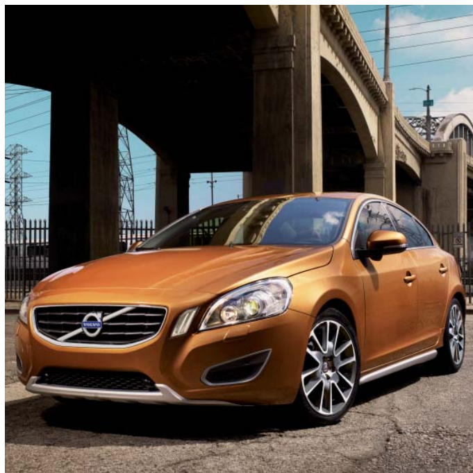
Außendesign: Frontspoilereinsatz, Dekorrahmen, Schwellerleisten, Leichtmetallfelgen „Freja“