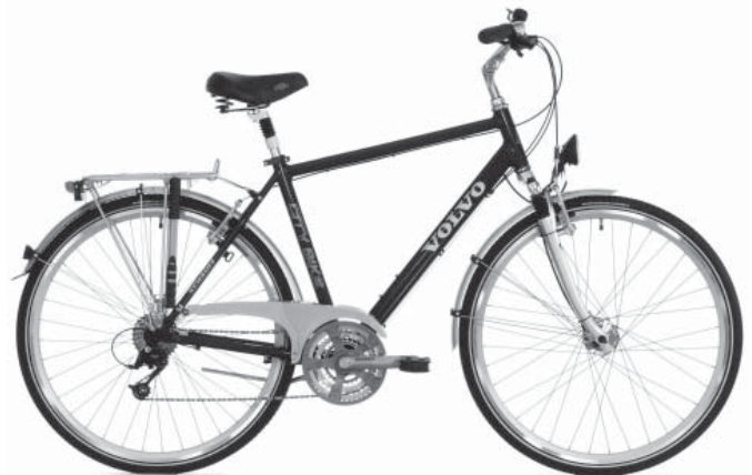
Volvo CITY BIKE, Herren