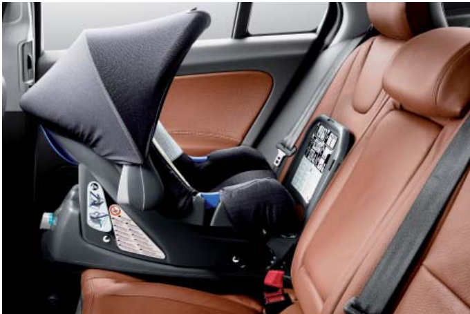
Babyschale und ISOFIX Basis