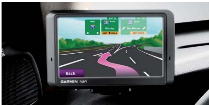
Mobiles Navigationssystem „Garmin nüvi® 765“

* Die Bluetooth® –Wortmarke und –Logos sind Eigentum der Bluetooth SIG Inc.