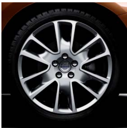
„Freja“, Diamantschnitt/Hellgrau, 8,0x18"