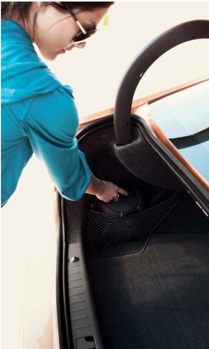
Netztasche und Kofferraum-Wendematte