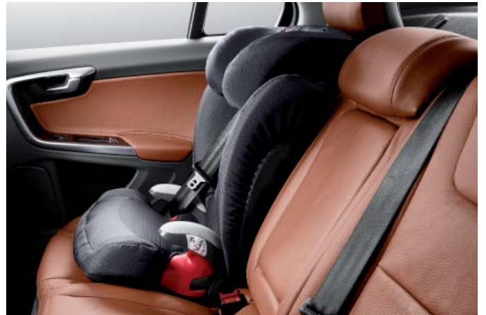
Gurtkissen mit Rückenlehne