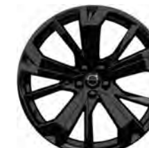
21 英寸 极夜黑版 铝合金轮毂