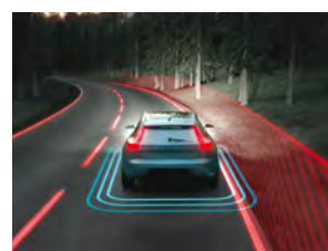
道路偏离预防系统