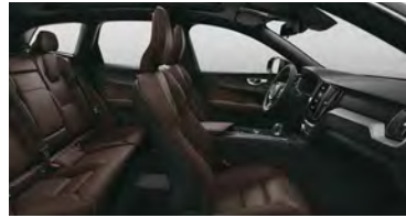
RE30 B5 四驱 智逸豪华版 黑色内饰 | 人体工程学 棕色Sakelyx皮质座椅 | Iron Ore 拉丝铝内饰条