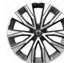
19 英寸 铝合金轮毂