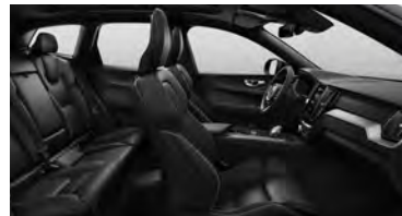
RC00 T8 插电式混合动力 四驱 长续航 智远极夜黑版 黑色内饰 | 人体工程学 黑色高级Nappa座椅 | Metal Mesh 金属网格内饰条