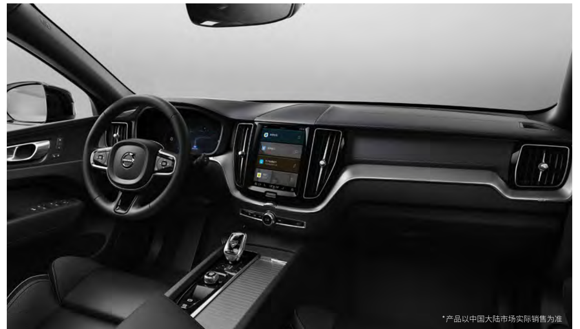
人体工程学Nappa+Open Grid织物运动型座椅