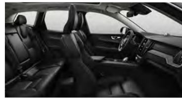
RC00 T8 插电式混合动力 四驱 长续航 智雅豪华版 黑色内饰 | 人体工程学 黑色高级Nappa座椅 | Drift Wood 漂流木内饰条