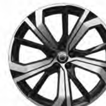
21 英寸 插混版 铝合金轮毂