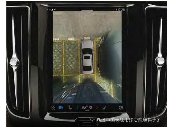
*产品以中国大陆市场实际销售为准

全新一代安全守护,不止多一点 360°鸟瞰视野安全守护* 20个超敏传感器,搭配超高速神经网络,打造360°鸟瞰视野全景视野守护;采用电控刹车系统,响应速度几乎是传统刹车系统的2倍,并配备准备驶离通知、向后自动刹车、紧急停车辅助等智能驾驶辅助功能,高速稳定安全科技更胜一筹。