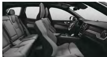
R471 T8 插电式混合动力 四驱 长续航 智雅豪华版 黑色内饰 | 人体工程学 浅灰色高级羊毛织物面料运动 座椅 | Drift Wood 漂流木内饰条

备注： · RC00 (极夜黑选装)、R471为选装内饰，需收取额外费用； · RE30、RA30、RGOR、RGAR、RC20、RC30、R471七款内饰使用黑色顶棚； · 本目录内容根据印制时车辆配置状态信息编制。鉴于沃尔沃汽车不断对汽车进行改型和改进，因市场客观的变化，中国大陆市场实际销售车型的部分配置及规格可能与本目录有所不同，具体产品以中国大陆实际销售为准。具体细节请咨询沃尔沃汽车授权经销商或直售服务商。