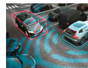
倒车车侧警示系统

安心安全,个性化再加分 个人化安全智能管理 依据你的个人行驶数据,为你定制专属安全智能升级方案,从此走你的路更安心。