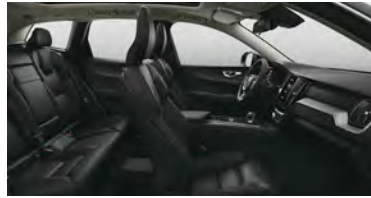
RD00 B5 四驱 智逸豪华版 黑色内饰 | 人体工程学 黑色Sakelyx皮质座椅 | Iron Ore 拉丝铝内饰条