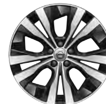
18 英寸 铝合金轮毂