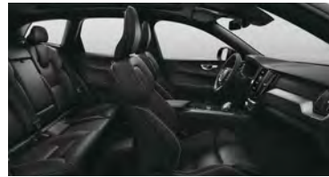
RGOR B5 四驱 智远运动版 | T8 插电式混合动力 四驱 长续航 智远运动版 | T8 插电式混合动力 四驱 长续航 智远极夜黑版 黑色内饰 | 人体工程学 黑色Nappa+Open Grid 织物运动座椅 | Metal Mesh 金属网格内饰条