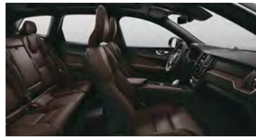
RC30 T8 插电式混合动力 四驱 长续航 智雅豪华版 黑色内饰 | 人体工程学 棕色高级Nappa座椅 | Linear Lime 直纹榎木内饰条