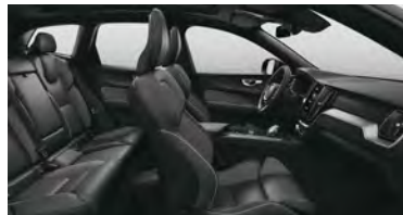
RGAR B5 四驱 智远运动版 | T8 插电式混合动力 四驱 长续航 智远运动版 黑色内饰 | 人体工程学 灰色Nappa+Open Grid 织物运动座椅 | Metal Mesh 金属网格内饰条