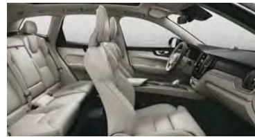
UC00 T8 插电式混合动力 四驱 长续航 智雅豪华版 米色内饰 | 人体工程学 米色高级Nappa座椅 | Drift Wood 漂流木内饰条