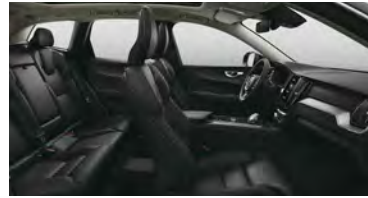
RA00 B5 四驱 智远豪华版 | T8 插电式混合动力 四驱 长续航 智远豪华版 黑色内饰 | 人体工程学 黑色Moritz座椅 | Metal Mesh 金属网格内饰条