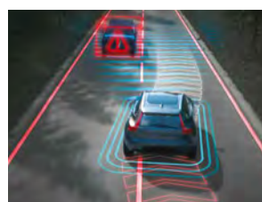
对向车辆智能避让