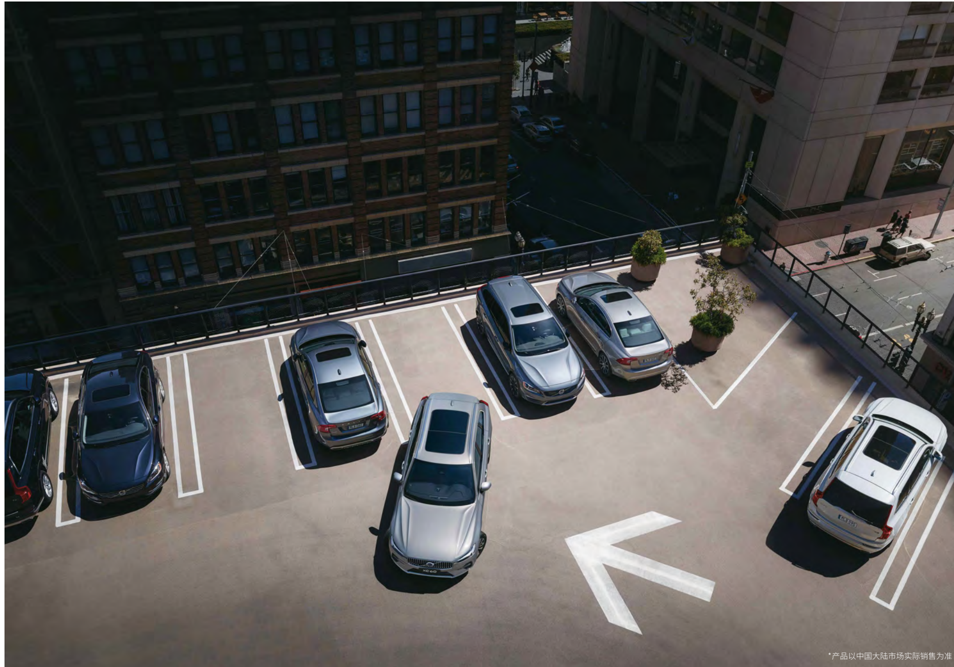
*产品以中国大陆市场实际销售为准

全新一代安全守护,不止多一点 360°鸟瞰视野安全守护* 20个超敏传感器,搭配超高速神经网络,打造360°鸟瞰视野全景视野守护;采用电控刹车系统,响应速度几乎是传统刹车系统的2倍,并配备准备驶离通知、向后自动刹车、紧急停车辅助等智能驾驶辅助功能,高速稳定安全科技更胜一筹。