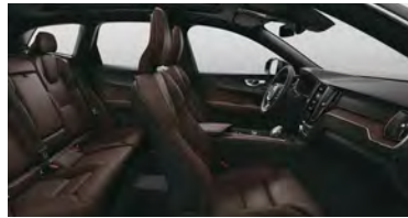
RA30 B5 四驱 智远豪华版 | T8 插电式混合动力 四驱 长续航 智远豪华版 黑色内饰 | 人体工程学 棕色Moritz座椅 | Linear Lime 直纹榎木内饰条