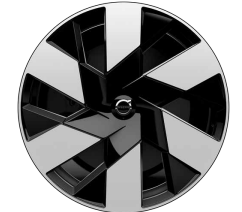
20 英寸 插混版 铝合金轮毂