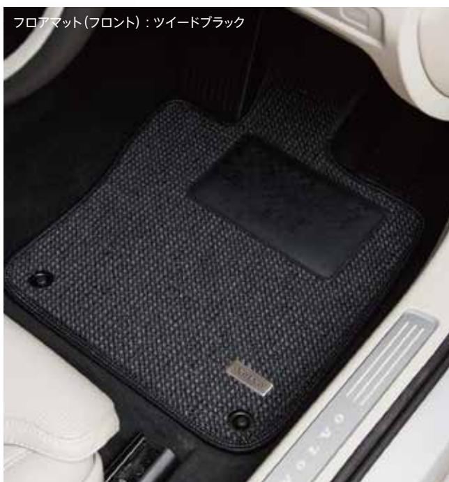
フロアマット(フロント)：ツイードブラック

ボリューム感を抑えてツイード調に織ることで、再生ペット素材がもつ繊維の艶とハリが存分に発揮され、ドライビング時、足の踏みしめ感でも高級さを実感できます。