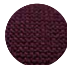
ツイード ボルドー

再生ペット素材の特性で撥水性が極めて向上し、汚れを寄せ付けず、防音効果、断熱効果、耐久性にも優れています。