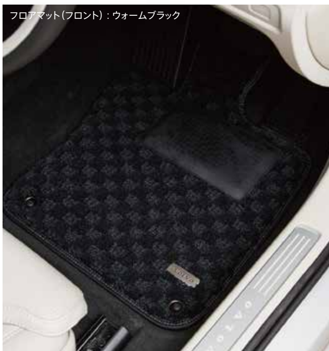
フロアマット(フロント)：ウォームブラック

毛足の長いカット＆ループ織りのボリューム感が車内に静寂をもたらし、超快適な空間を満喫いただける最高級タイプです。