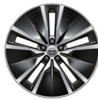
5ダブルスポーク 8.0J×19インチ ダイヤモンドカット/ブラック