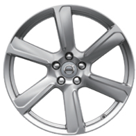
6スポーク タービン 8.0J×19インチ シルバードーン