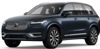
Denim Blue Metallic