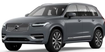
Thunder Grey Metallic