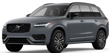
Thunder Grey Metallic