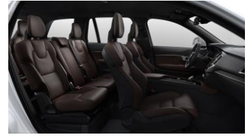
Maroon Brown ventilated Nappa leather and Black Ash decor