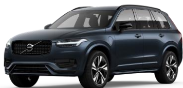
Denim Blue Metallic