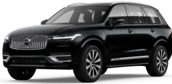
Onyx Black Metallic