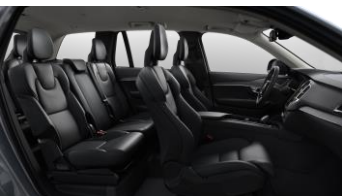
Charcoal ventilated Nappa leather and Grey Ash decor

Some parts of upholstery are mixed with leatherette. บางชิ้นส่วนของเบาะโดยสารมีส่วนผสมของหนังสังเคราะห์