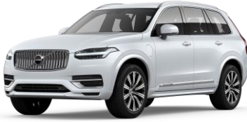
Crystal White Premium Metallic