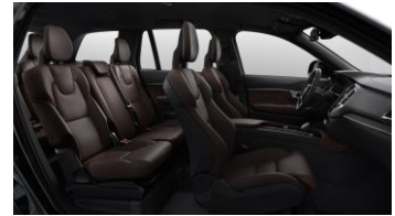
Maroon Brown ventilated Nappa leather and Black Ash decor