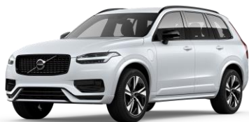
Crystal White Premium Metallic