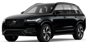
Onyx Black Metallic