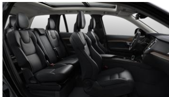
Charcoal Moritz leather and Linear Walnut Decor