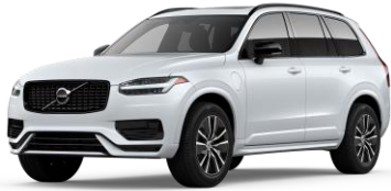
Crystal White Premium Metallic