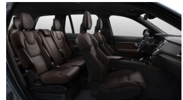
Maroon Brown ventilated Nappa leather and Black Ash decor