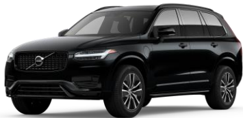
Onyx Black Metallic