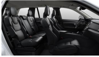
Charcoal ventilated Nappa leather and Grey Ash decor