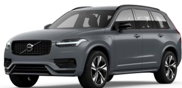
Thunder Grey Metallic