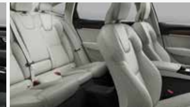
블론드 & 차콜 색상 인테리어