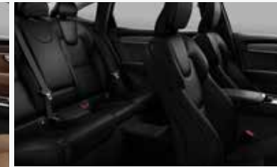
차콜 & 차콜 색상 인테리어