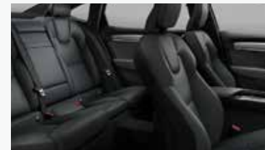
슬레이트 & 차콜 색상 인테리어