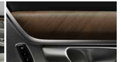
INLAYS Linear Walnut