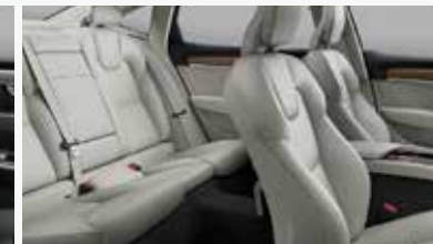
블론드 & 차콜 색상 인테리어