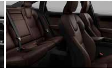
마룬 브라운 & 차콜 색상 인테리어