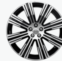
20" 8-Multi Spoke Black Diamond Cut