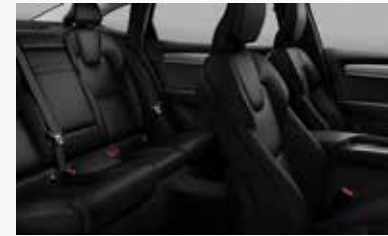
차콜 & 차콜 색상 인테리어