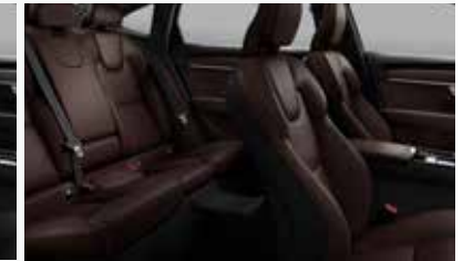
마룬 브라운 & 차콜 색상 인테리어