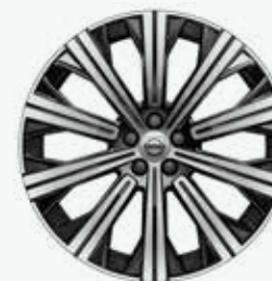
19" 10-Spoke Black Diamond Cut