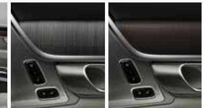
INLAYS Grey Ash Wood