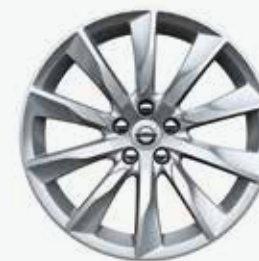
18" 10-Spoke Turbine Silver Bright