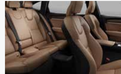
앰버 & 차콜 색상 인테리어