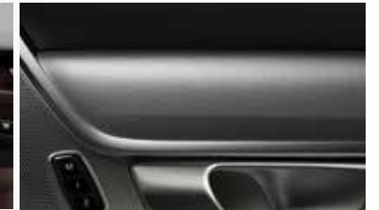
INLAYS Checkered Aluminium