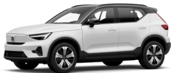
Crystal White Pearl