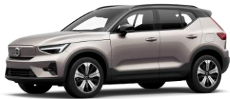
Bright Dusk Metallic