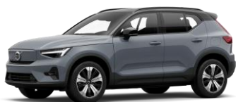
Thunder Grey Metallic