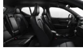
Charcoal Fusion Microtech/ Textile in Charcoal Interior