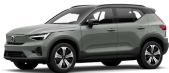
Sage Green Metallic