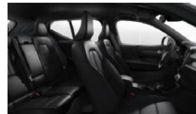
Charcoal Fusion Microtech/ Textile in Charcoal Interior