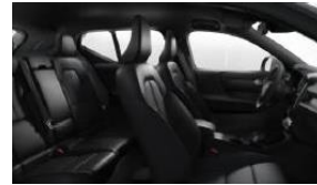
Charcoal Fusion Microtech/ Textile in Charcoal Interior