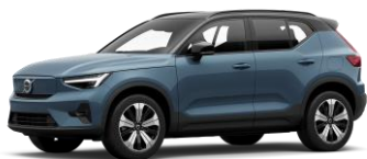
Fjord Blue Metallic