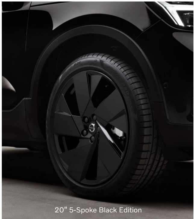
20" 5-Spoke Black Edition