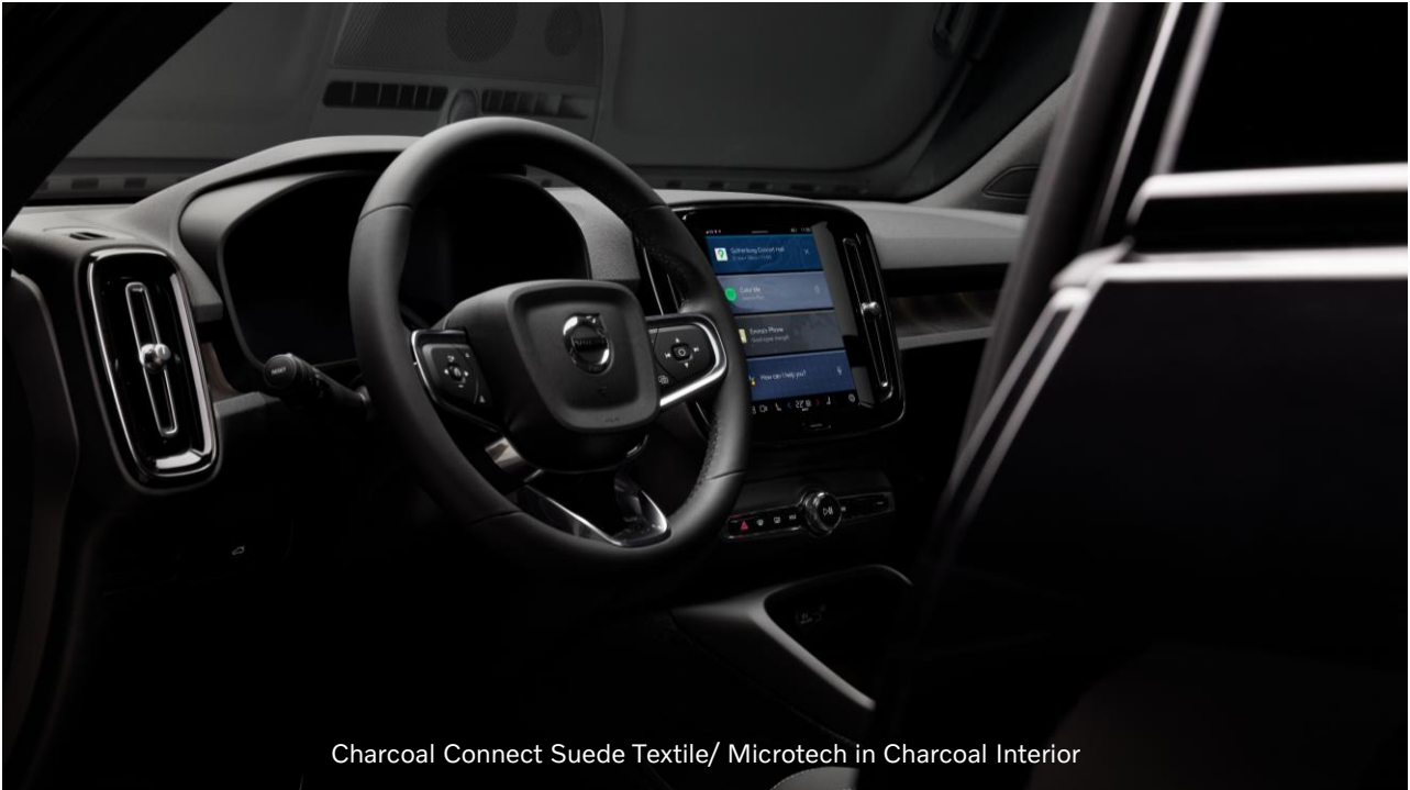
Charcoal Connect Suede Textile/ Microtech in Charcoal Interior